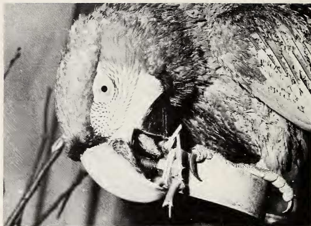
Abb. 1: Zuhilfenahme von Rinde beim Abdrehen einer Mutter

chenden Richtung, drehte der Vogel die Mutter ab. Nicht immer gelang es sogleich, die Verschraubung zu öffnen. In diesem Fall nahm der Ara ein Stück Rinde, einen Zweig, ein Blatt oder manchmal ein Steinchen und klemmte es zwischen den Unterschnabel und die zu lockernde Mutter (Abb. 1), ähnlich wie man selbst, um die Reibung zu erhöhen, ein Tuch zu Hilfe nimmt, wenn sich ein Gefäß schwer öffnen läßt. Diese Methode wandten beide Aras auch bei sehr hartschaligen Nüssen an.